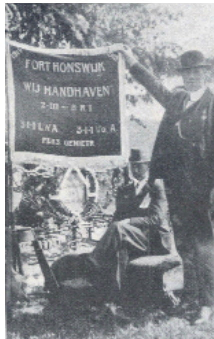
Van boven naar beneden: Vaandel fort Honswijk Herinneringsmedaille fort Honswijk 1915 Reuniekruis 1934 fort Honswijk A. Kaptein met vaandel